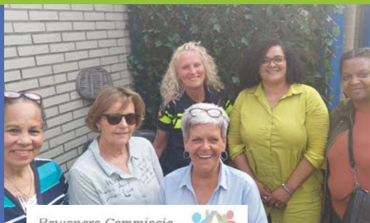
Bewoners Commissie Kerngroep "Amsterdamse Poort"

Samen met een aantal bewoners uit de Amsterdamse Poort zijn wij sinds april van dit jaar officieel de Bewonerscommissie: 'Kerngroep Amsterdamse Poort'. Wij zetten ons in voor de leefbaarheid, het tegengaan van overlast én denken mee over de verbouwing in de Poort. De bewonerscommissie zit daarvoor bijvoorbeeld aan tafel met CBRE IM, Ymere, politie, gemeente Amsterdam en ondernemers.